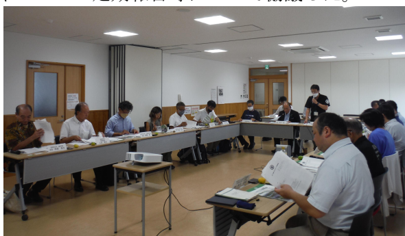
〈 9/15 第14回 綾BR専門委員会 〉

綾BR専門委員会を9月に開催し、各事業の進捗状況の報告、大学研究機関との連携事業の報告、ユネスコへの定期報告等について協議した。