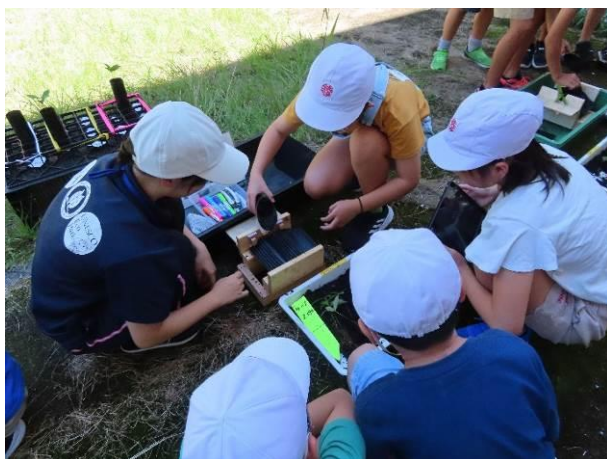
綾小学校での苗移植の様子（9月4日）