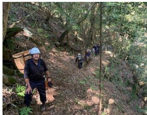
綾町自然体験・環境学習グループによる歩道整備