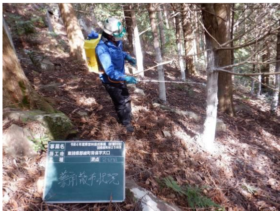
獣害防除(忌避剤散布)