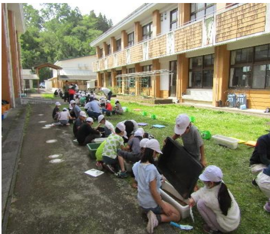
綾小学校での蒔き付けの様子（4月18日）