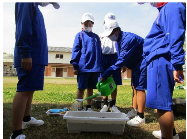
綾中学校での蒔き付けの様子（4月27日）